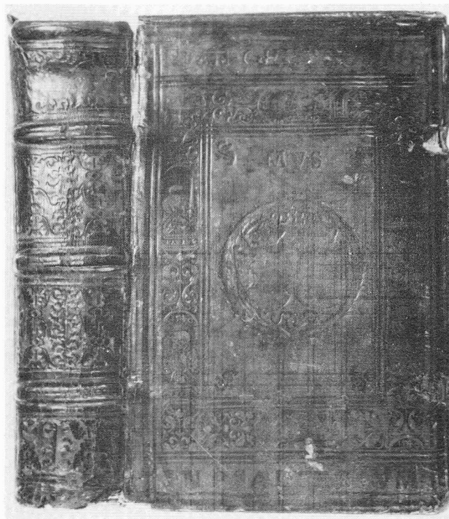
Boekband in blind en met goudleer bestempeld kalfsleer, vermoedelijk gemaakt door de Krakówse binder Jerzi Moeller in 1551 voor de Poolse koning Sigismundus Augustus (Koninklijke Bibliotheek, Den Haag, 1787 D 39). Te zien in Den Haag.

GRONINGEN Universiteitsbibliotheek: Oogst van een kwart eeuw. Een keuze uit de aanwinsten van de Universiteitsbibliotheek verworven tijdens het bibliothecariaat van Mr. W.H.R. Koops, 1964-1990. 29 september - 16 november 1990. Met catalogus van ca. 80 pp. ISBN 9-0367-0231-3. Enkele punten van aandacht: de collectievorming en het werk van Gerard Ketel, de eerste Groningse drukker-uitgever met een redelijk fonds.